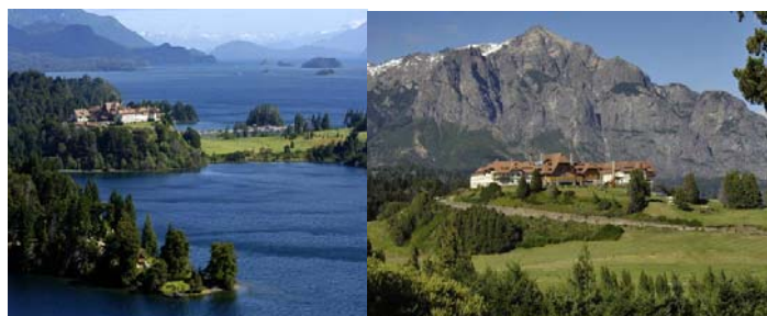
Península Llao Llao

Desayuno. Traslado al aeropuerto con destino final Buenos Aires. Fin de nuestros servicios.