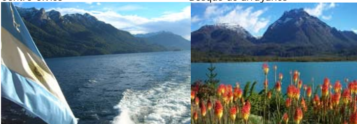
Cruce de Lago**