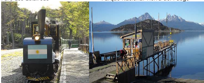
Tren del fin del Mundo