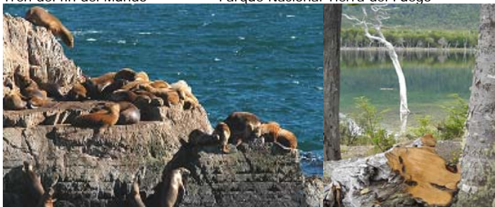
Isla de los Lobos