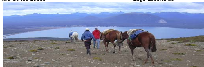
Cabalgata Lago Roca**

Alojándose en Hotel Fueguino 4*: USD 337.00